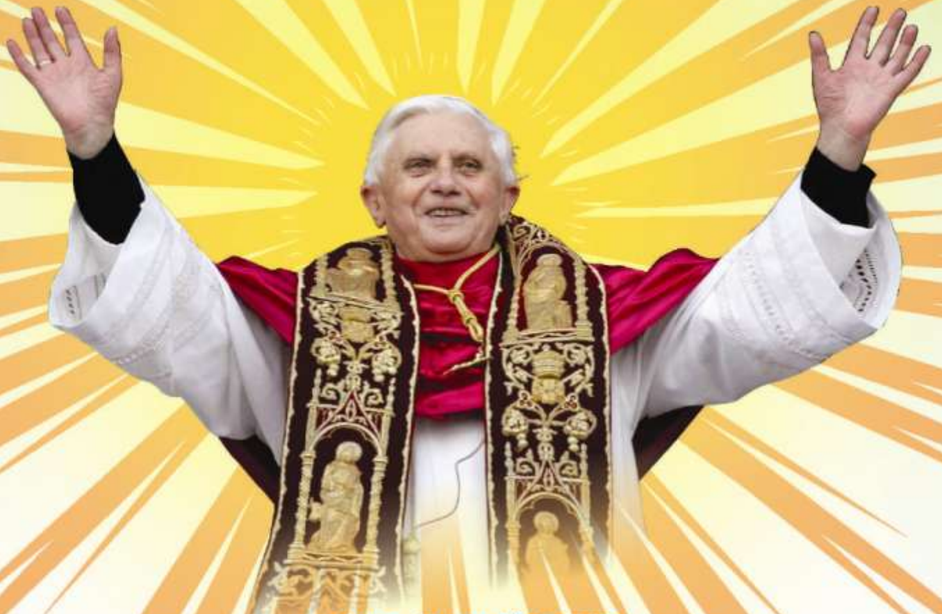
Pope Benedict XVI